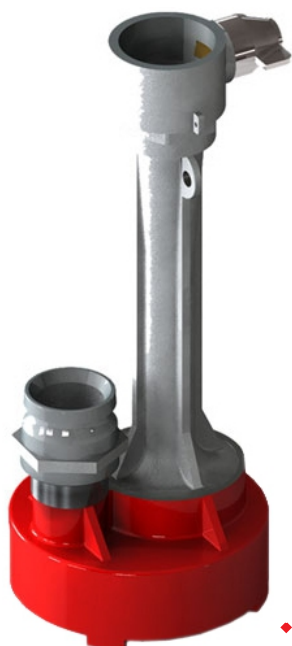
Ejector Pump ♦ Model: TR-EP2

پمپ تخلیه ونتوری / مکشی (اجکتور پمپ)، دستگاهی است ساده، اما بسیار کارآمد که جهت تخلیه مایعات از انبارها، چاهها و گودها، مورد استفاده قرار میگیرد.